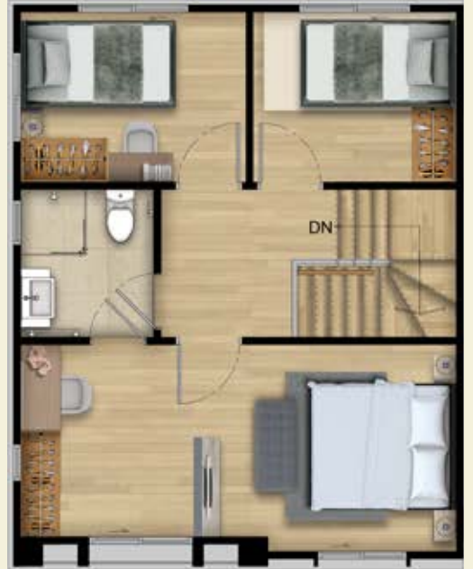
2 st Floor