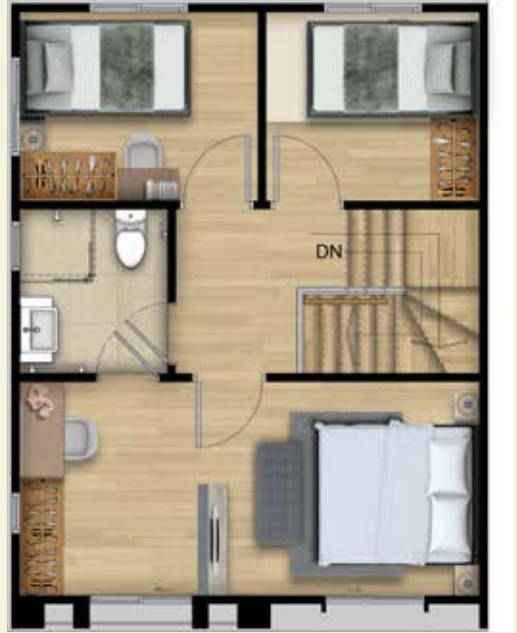
2 st Floor