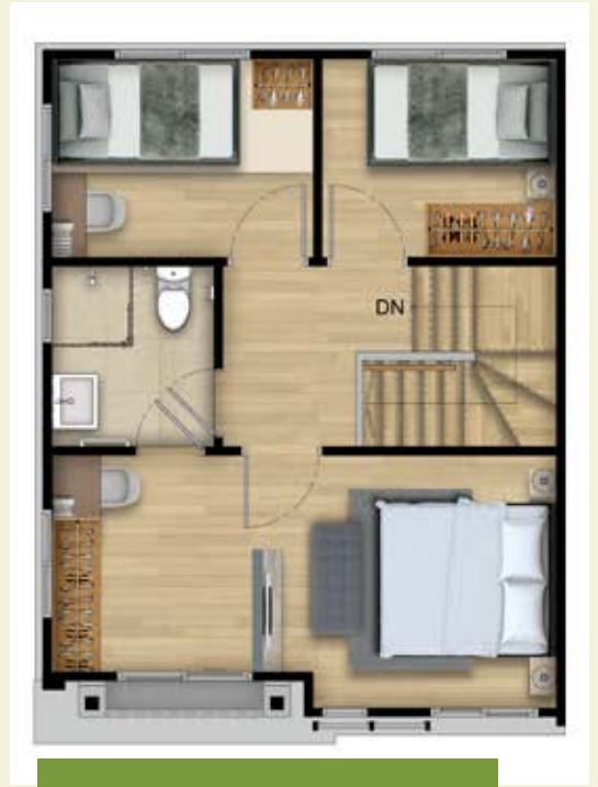
2 st Floor