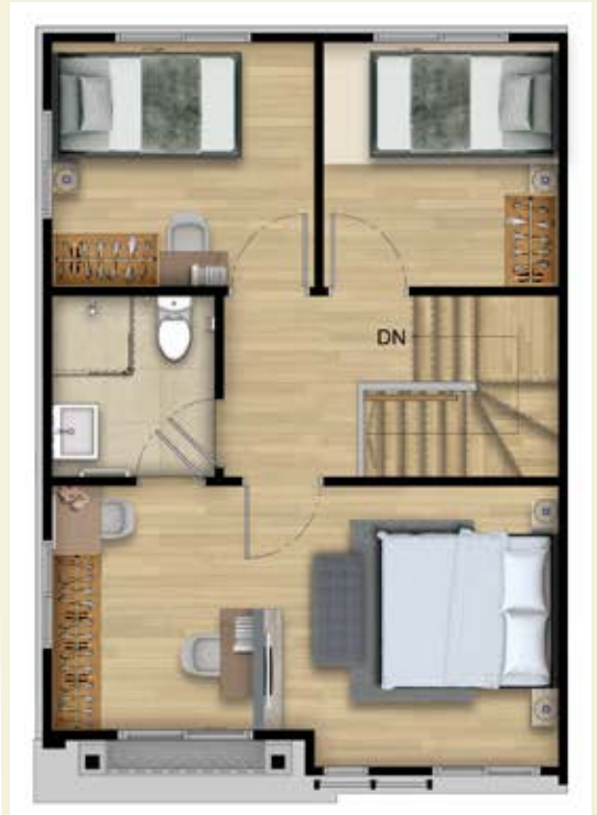
2 st Floor