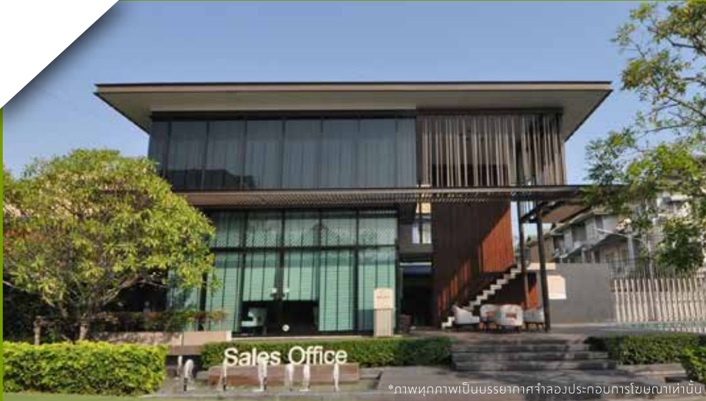
*ภาพทุกภาพเป็นบรรยากาศจำลองประกอบการโฆษณาเท่านั้น