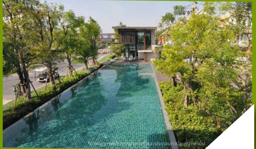
*ภาพทุกภาพเป็นบรรยากาศจำลองประกอบการโฆษณาเท่านั้น