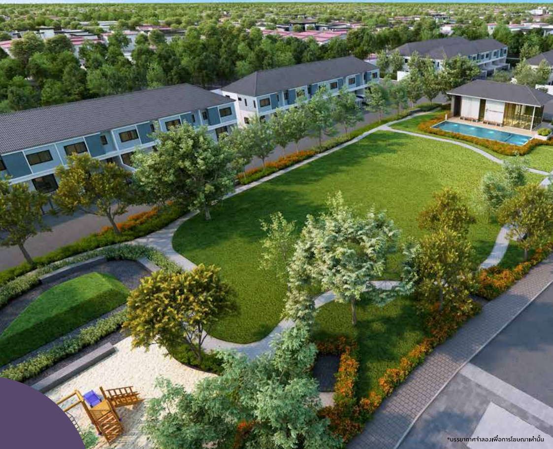
*บรรยากาศจำลองเพื่อการโฆษณาเท่านั้น