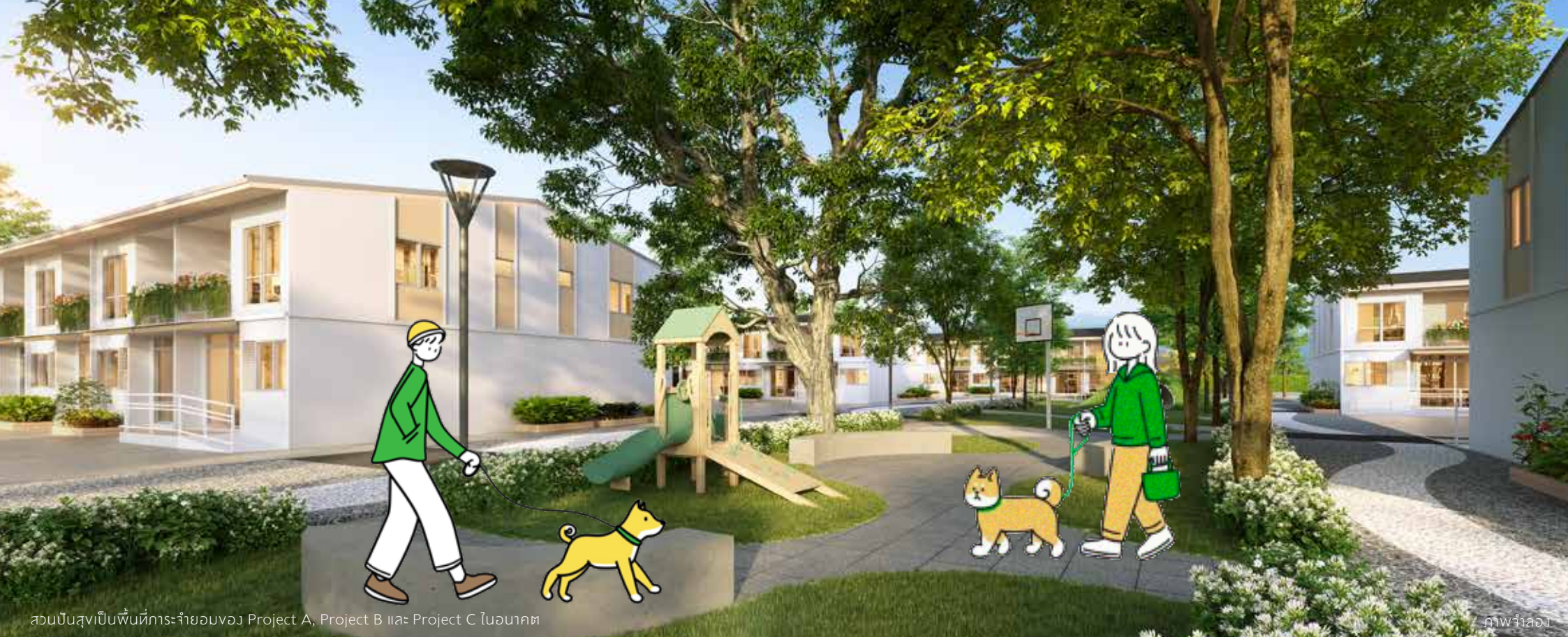
สวนปันสุขเป็นพื้นที่การกระจายของ Project A, Project B และ Project C ในอนาคต