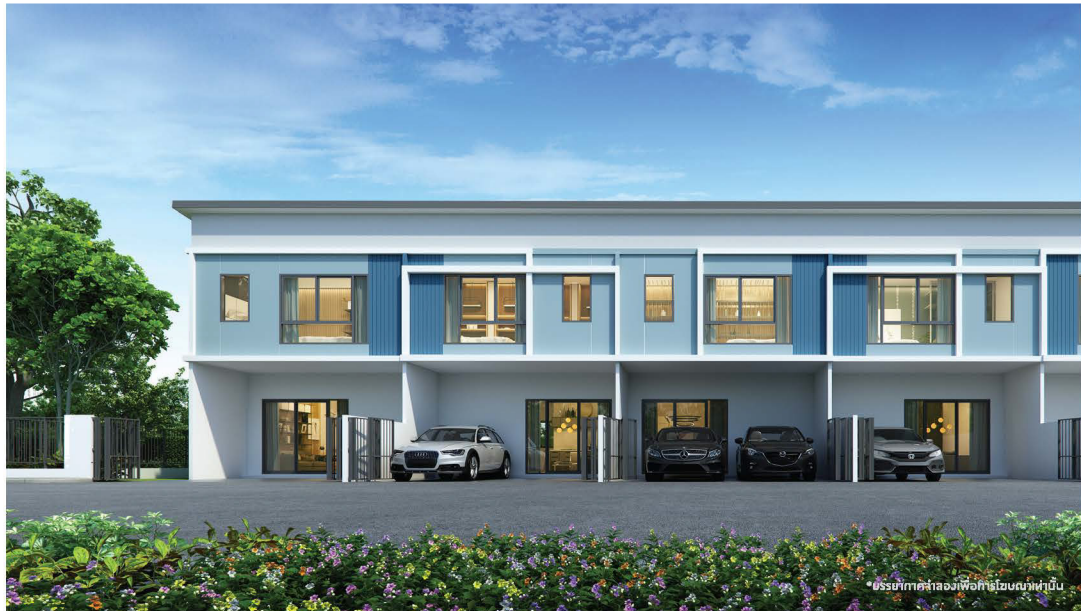
*บรรยากาศจำลองเพื่อคำอธิบายเท่านั้น