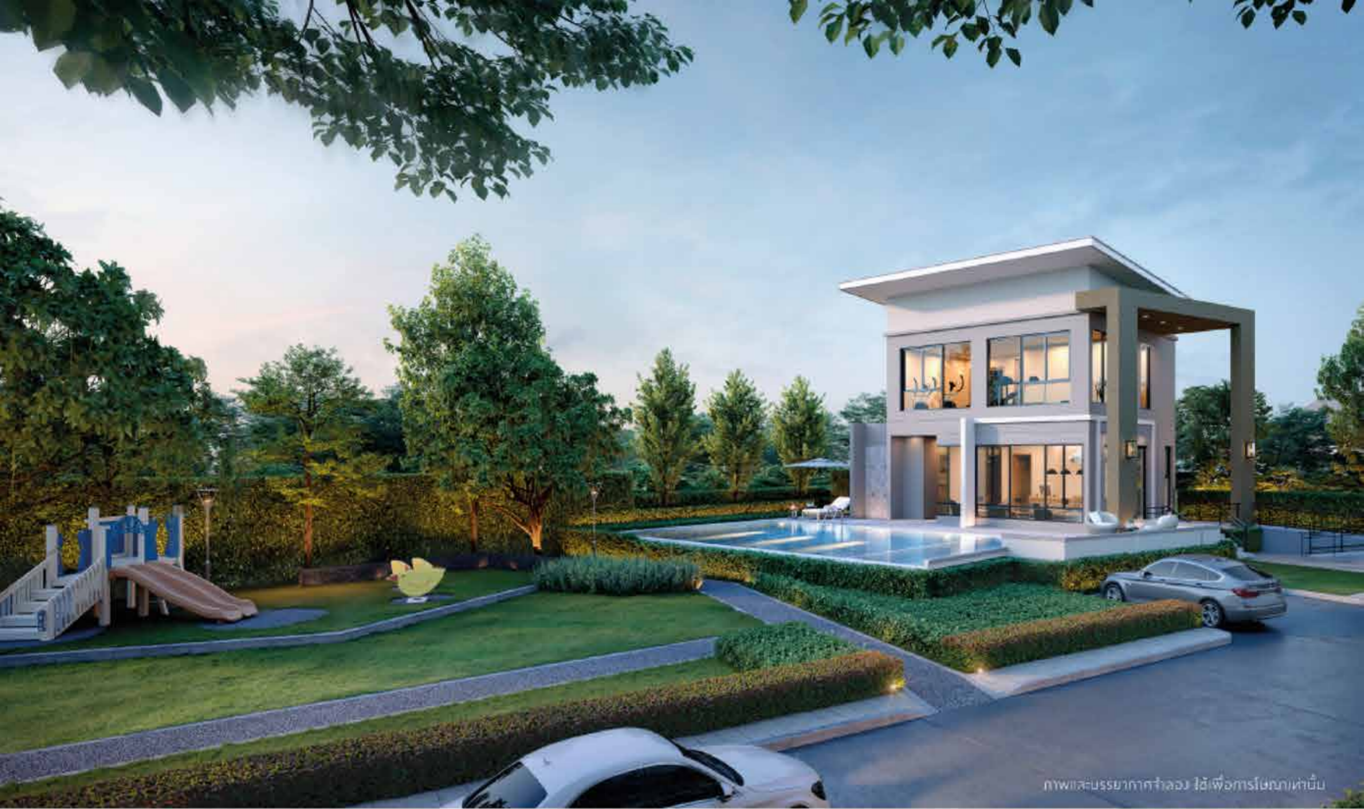
ภาพและบรรยากาศจำลอง ใช้เพื่อการโฆษณาเท่านั้น