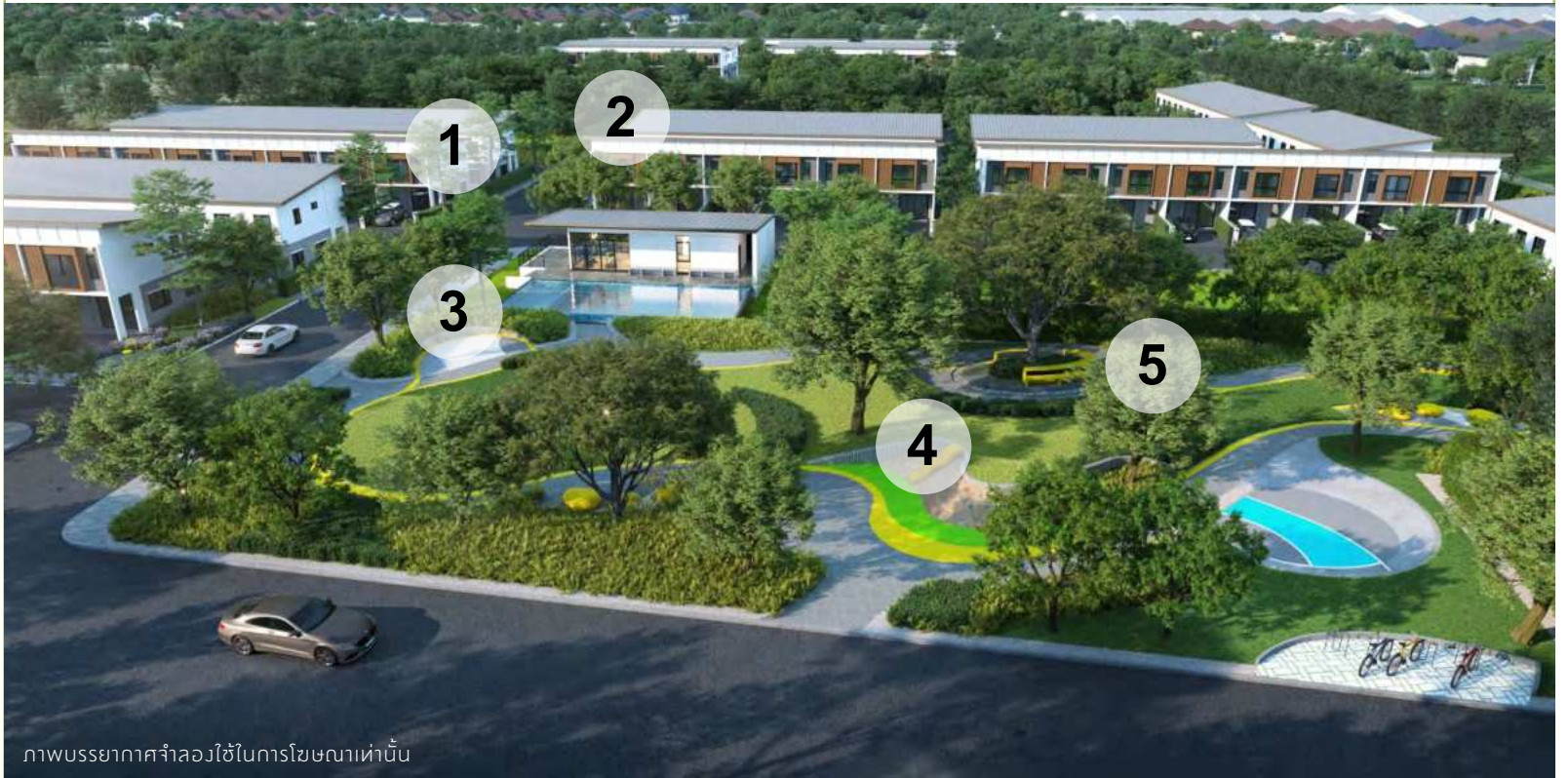
ภาพบรรยากาศจำลองใช้ในการโฆษณาเท่านั้น