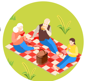
ภาพบรรยากาศจำลองใช้ในการโฆษณาเท่านั้น

มุมดี ๆ ที่ให้คุณพักผ่อนใกล้ซีรีส์ธรรมชาติ พร้อมคอยแอบมองลูกน้อยทำกิจกรรม ได้อย่างไม่ต้องเป็นห่วง