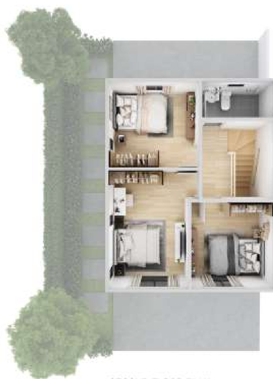
SECOND FLOOR PLAN