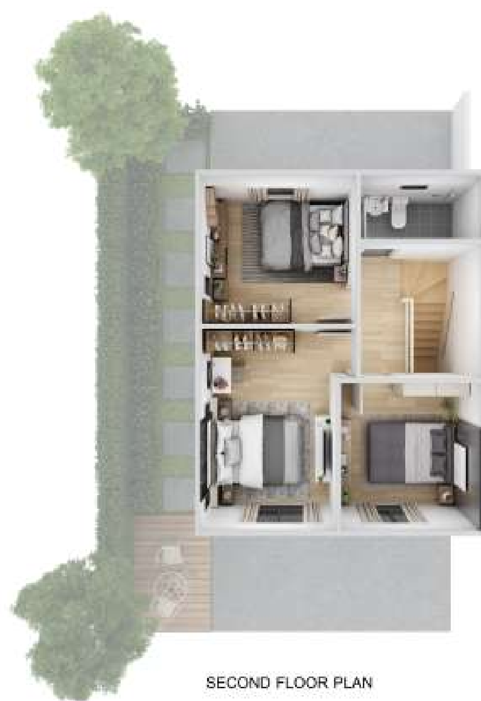
SECOND FLOOR PLAN