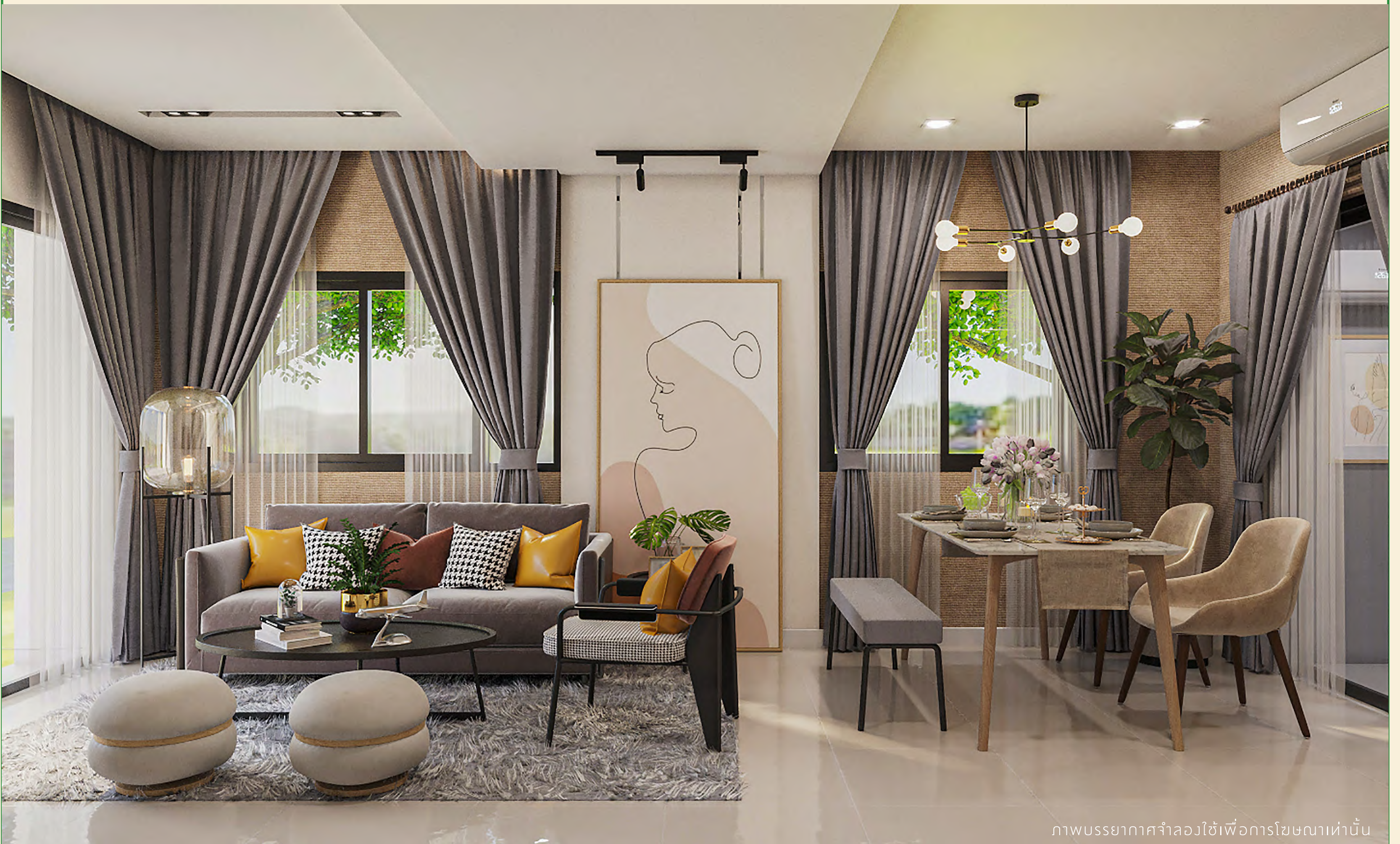
ภาพบรรยากาศจำลองใช้เพื่อการโฆษณาเท่านั้น