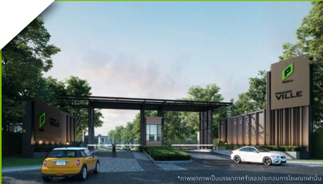
*ภาพทุกภาพเป็นบรรยากาศจำลองประกอบการโฆษณาเท่านั้น