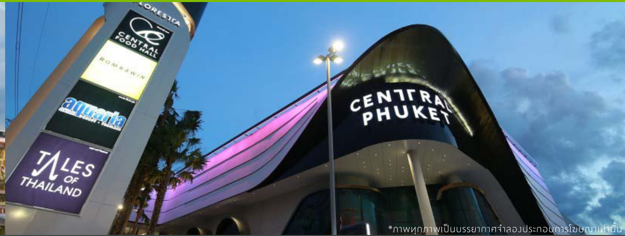
*ภาพทุกภาพเป็นบรรยากาศจำลองประกอบการโฆษณาเท่านั้น