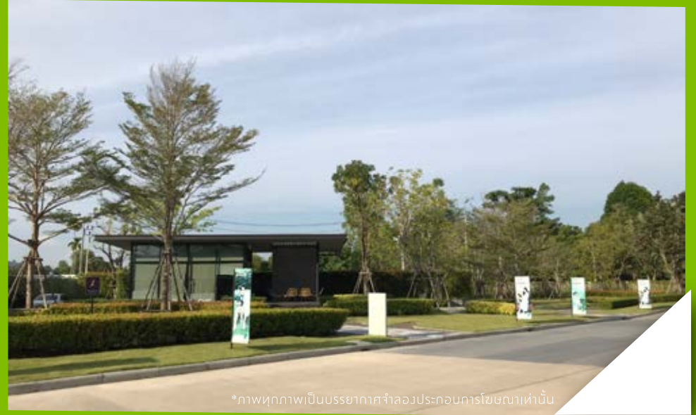
*ภาพทุกภาพเป็นบรรยากาศจำลองประกอบการโฆษณาเท่านั้น